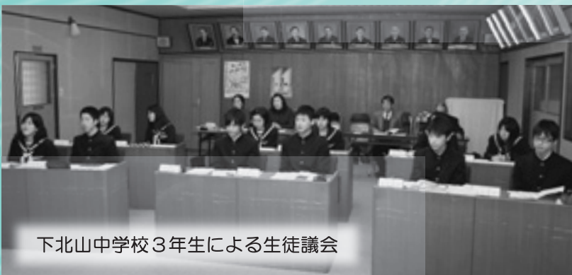
下北山中学校3年生による生徒議会